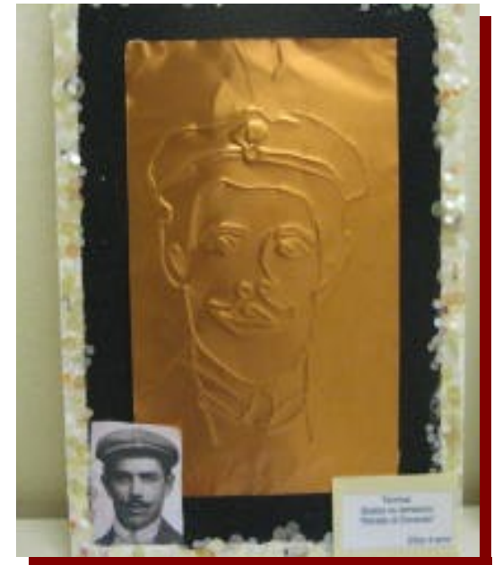
ricalco su lamierino di immagine di Dorando