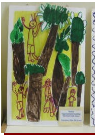
disegni in rilievo con pennarelli e gessetti