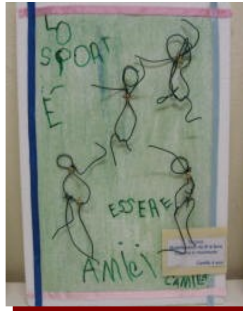
modellamento con fil di ferro di sagome in movimento