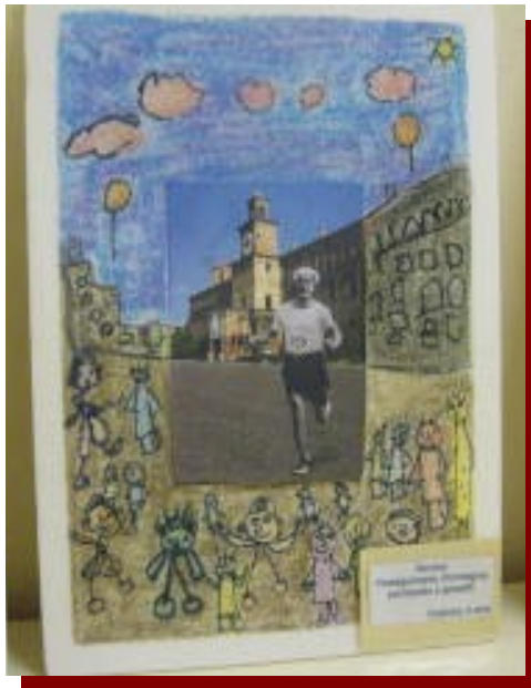
prolungamento d'immagine con pennelli e gessetti

GLI ELABORATI: su pannelli di polistirolo lavori di gruppo con tecniche varie