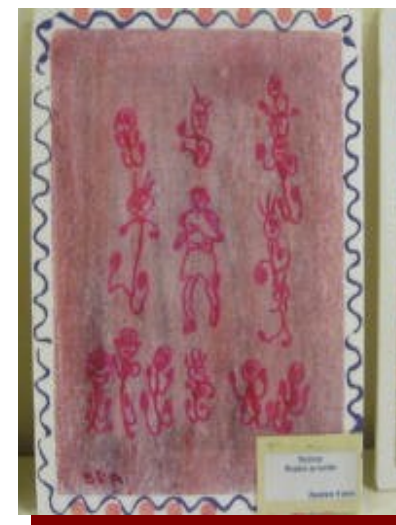
ricalco su lucido