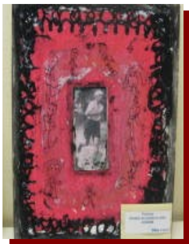
ricalco su lucido e colle colorate