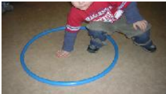
Metti un piede e una mano DENTRO al cerchio