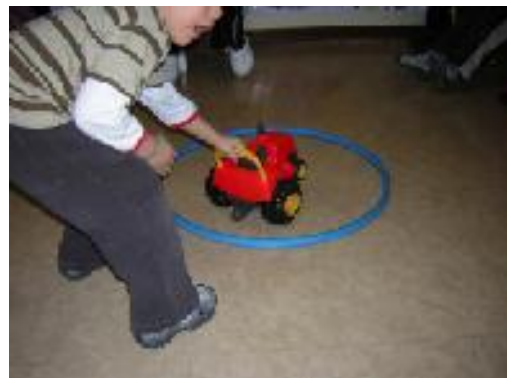
Metti la macchina DENTRO al cerchio