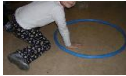
Metti una mano DENTRO al cerchio