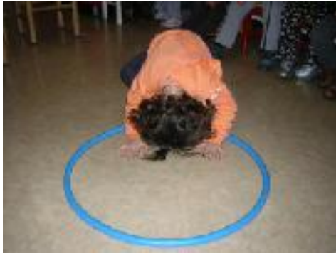
Metti la testa DENTRO al cerchio