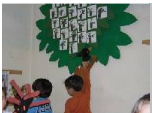
Io vado sull'albero vanitoso!!