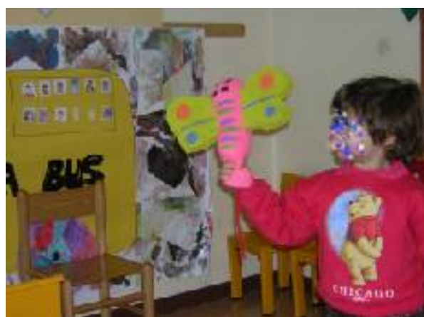
Io me ne vado sull'albero!!