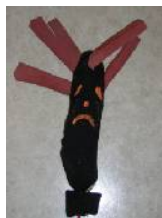
L'albero piangente in inverno

◆ Le attività drammatico-teatrali sono finalizzate allo sviluppo di processi di identificazione-proiezione. I bambini sono coinvolti emotivamente ed attivamente.