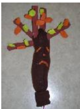
L'albero triste in autunno