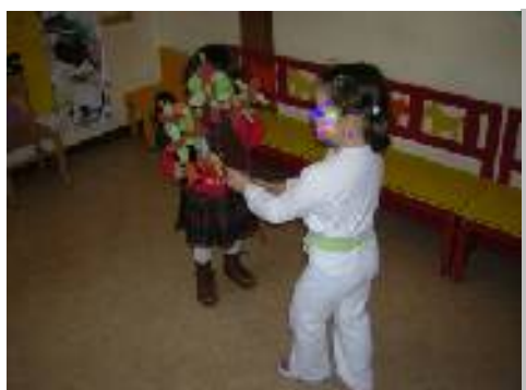
Sta arrivando il gatto!! Via...via!!