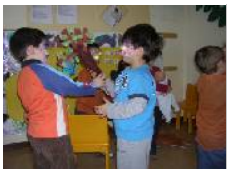
Albero sono l'uccellino posso venire su?