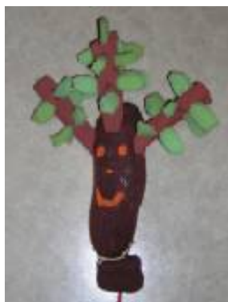
L'albero sorridente in primavera