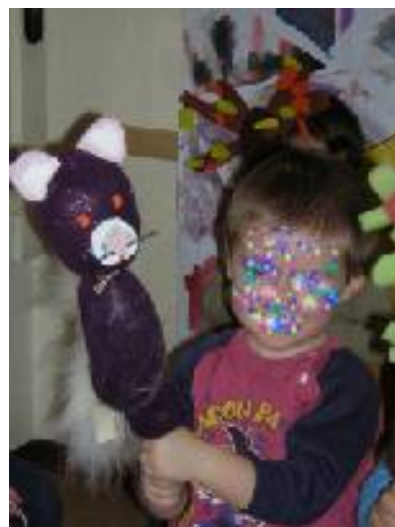
Questo albero ha la faccia da sberle!! Ciao io mi chiamo gatto "Tom e Gerry"!