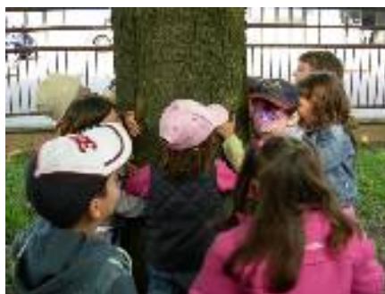
Il nostro albero vanitoso!! Corriamo ad abbracciarlo!