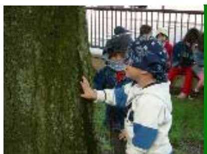
Ad occhi bendati tocchiamo il tronco... che sensazione dà la corteccia?