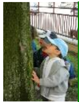
E se guardiamo bene...c'è anche qualche insetto!!