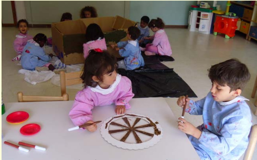
Costruiamo la barca con il timone e la vela