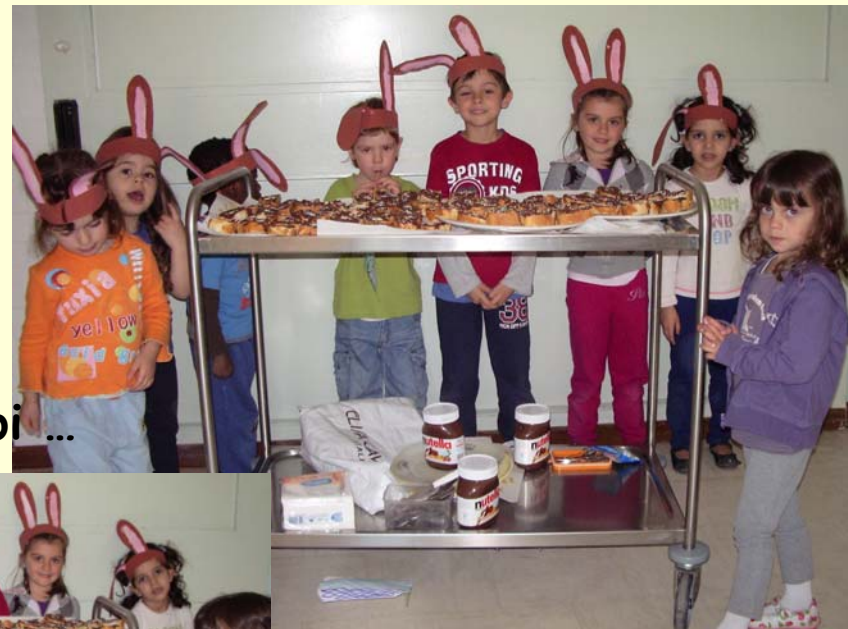
... mangiamo insieme una buona merenda!!