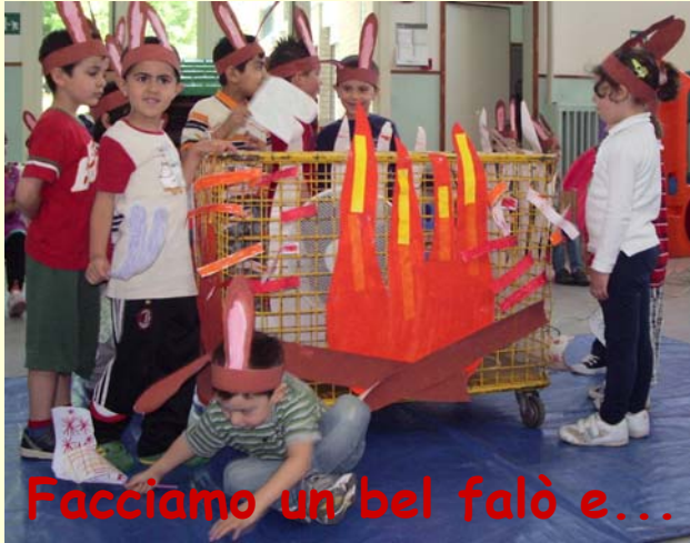
Facciamo un bel falò e...