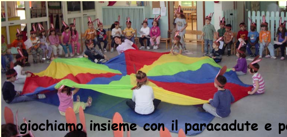
giociamo insieme con il paracadute e poi...