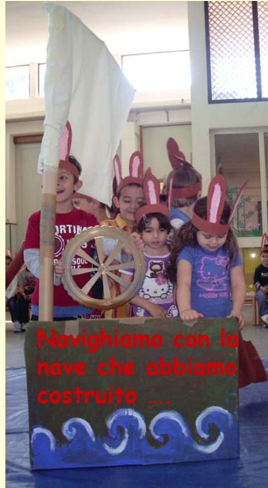
Navighiamo con la nave che abbiamo costruito ...