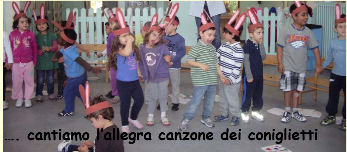
.... cantiamo l'allegria canzone dei coniglietti