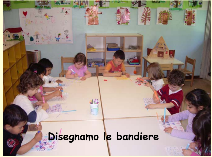
Disegniamo le bandiere