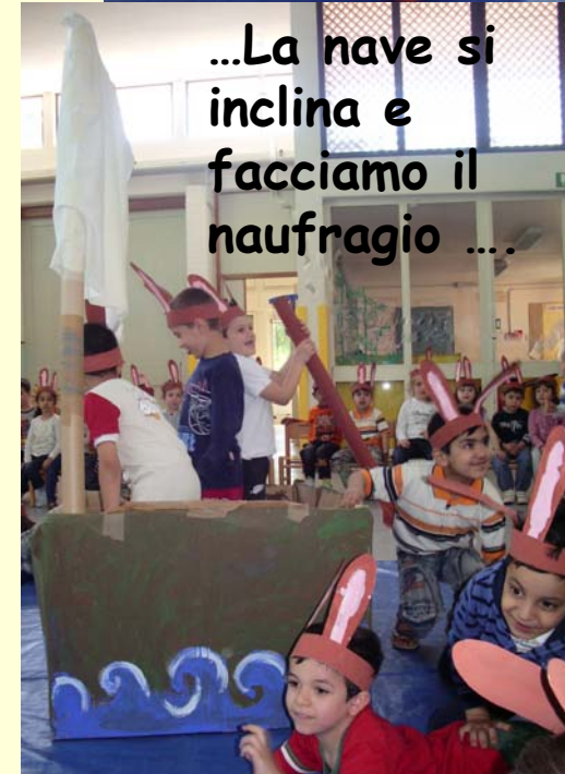
...La nave si inclina e facciamo il naufragio ...