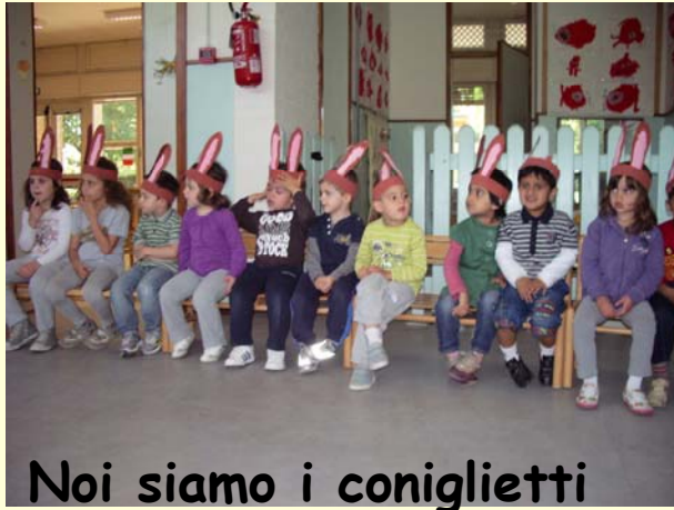
Noi siamo i coniglietti